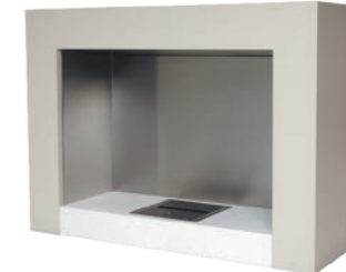
Oxygen* h 873mm b 1200mm d 405mm h 34.4in b 47.2in d 15.9in