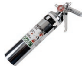
Brandsläckare h 390mm b 160mm h 15in b 6in