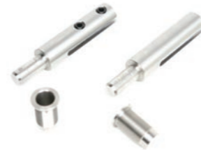
Twin Feet Fixings (Ben till firescreen) höjd över underlaget 150mm, 6in nedsänkning 60mm, 2in diameter 40mm, 1.58in