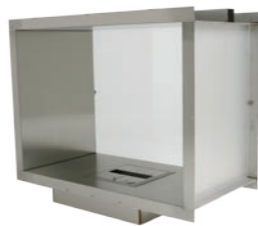
Firebox 900DB* h 813mm b 1000mm d 512mm h 32in b 39.4in d 20.2in

De angivna måtten avser fire boxens framsida och inkluderar distanserna. ° Denna box inkluderar inte en icke brännbar hylla för brännaren att monteras i. Detta måste ordnas av er installatör utifrån varje enskilt behov. * Inkluderar Wind Screen Static.