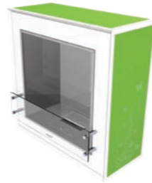
Switch* h 949mm b 943mm d 406mm h 37.4in b 37.1in d 16in