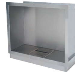
Firebox 900SS* h 813mm b 946mm d 356mm h 32in b 37.3in d 14in