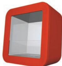
Retro h 878mm b 880mm d 581mm h 34.6in b 34.6in d 22.9in