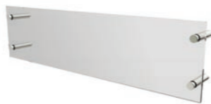
Fastmonterad wind screen h 205mm d 102mm h 8.1in d 4in b Varierar efter vilken modell som köpts.