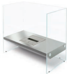
Igloo h 900mm b 977mm d 493mm h 35.4in b 38.5in d 19.4in