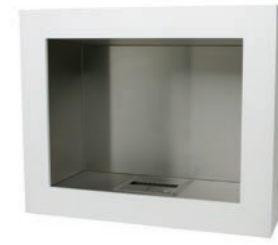
Aspect* h 950mm b 1145mm d 392mm h 37.4in b 45.1in d 15.4in