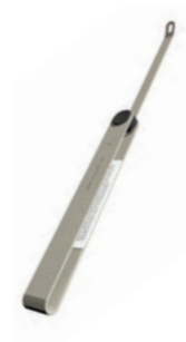
Tänd- och reglerstav l 657mm l 25.9in