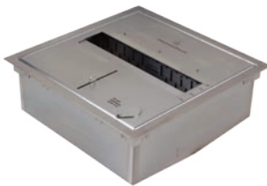
Burner One - Tankvolym 5 liter h 111.8mm b 290mm d 290mm h 4.4in b 11.4in d 11.4in