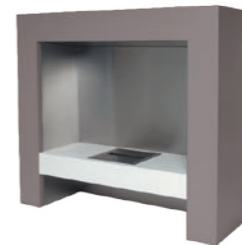
Element* h 1055mm b 1200mm d 405mm h 41.5in b 47.2in d 15.9in