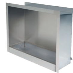
Firebox 900LO** h 764mm b 996mm d 356mm h 30.1in b 39.2in d 14in