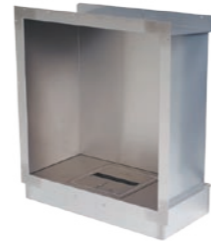
Firebox 650SQ* h 814mm b 746mm d 356mm h 32in b 29.4in d 14in