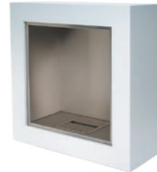
Cube* h 945mm b 945mm d 392mm h 37.2in b 37.2in d 15.4in