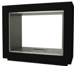
Vision* h 990mm b 1190mm d 536mm h 39in b 46.9in d 21.1in