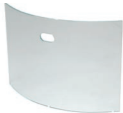
Fire Screen Mono h 604mm b 840mm d 166mm h 23.8in b 33.1in d 6.6in