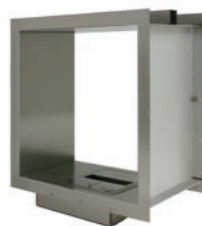
Firebox 650DB* h 814mm b 750mm d 414mm h 32in b 29.5in d 17.7in