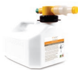
Säkerhetsdunk - 5 liter h 230mm b 210mm d 360mm h 9in b 8in d 14in