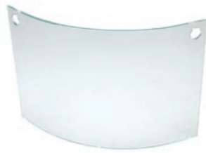
Fire Screen Duo h 604mm b 840mm d 166mm h 23.8in b 33.1in d 6.6in