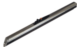
Tändare l 160mm l 6in