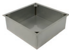
Monteringstrång h 114mm b 320mm d 320mm h 4in b 12.6in d 12.6in