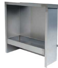
Firebox 900** h 952mm b 996mm d 356mm h 37.5in b 39.2in d 14in