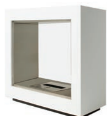
Fusion* h 990mm b 945mm d 450mm h 39in b 37.2in d 17.7in