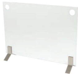
Fire Screen Plasma h 652mm b 850mm d 200mm h 25.7in b 33.5in d 7.9in